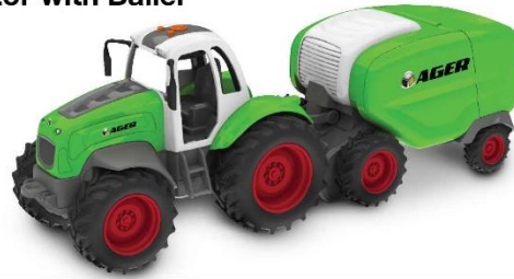
Tractor with Bailer