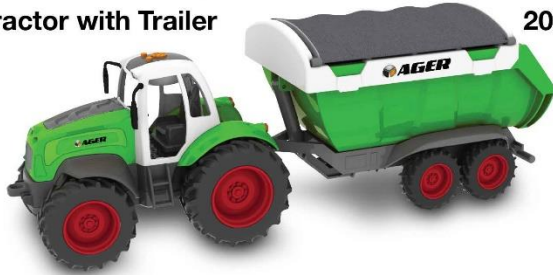
Tractor with Trailer