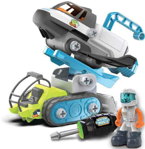
Mars Base Set